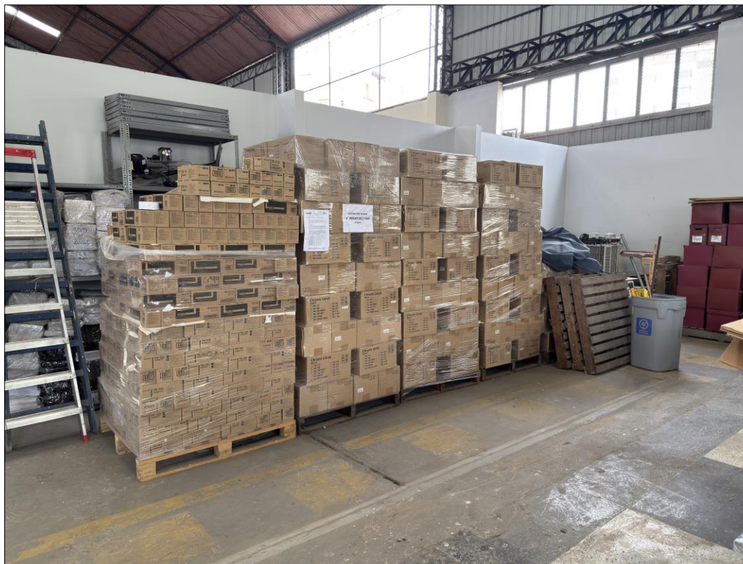
Imagen de los Un mil cuarenta y uno (1,041) bienes muebles no patrimoniales compuestos por “Tóner y consumibles”