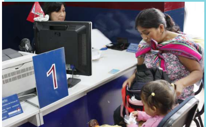
La madre puede o no revelar el nombre del presunto padre; pero el padre siempre deberá indicar cuál es el nombre de la madre.

Si solo declara uno de los progenitores, este podrá revelar el nombre de la persona con quien haya concebido al menor de edad (revelar el nombre del presunto progenitor es facultativo para la madre, pero obligatorio para el padre).