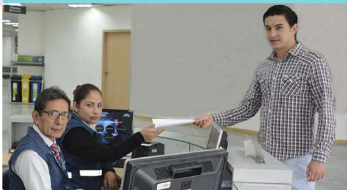
El mayor de edad debe realizar personalmente su solicitud de inscripción de nacimiento extemporáneo.

La solicitud de inscripción es personal y realizada directamente por el titular.