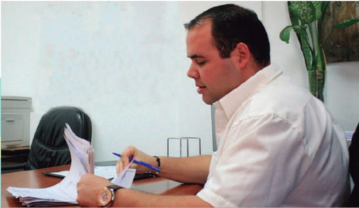
El expediente administrativo debe contener todos los documentos que den sustento a la solicitud de la inscripción.

El asiento registral que se pretende a través de una inscripción extemporánea de nacimiento, no debe haber sido inscrito previamente en ninguna oficina de registro civil de la república.