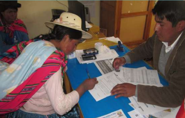
De acuerdo a la Ley N° 28720, bastará la presencia y declaración de uno de los progenitores para inscribir en el registro civil a un menor de edad con los apellidos de ambos padres.

En caso el padre sea el único progenitor declarante: