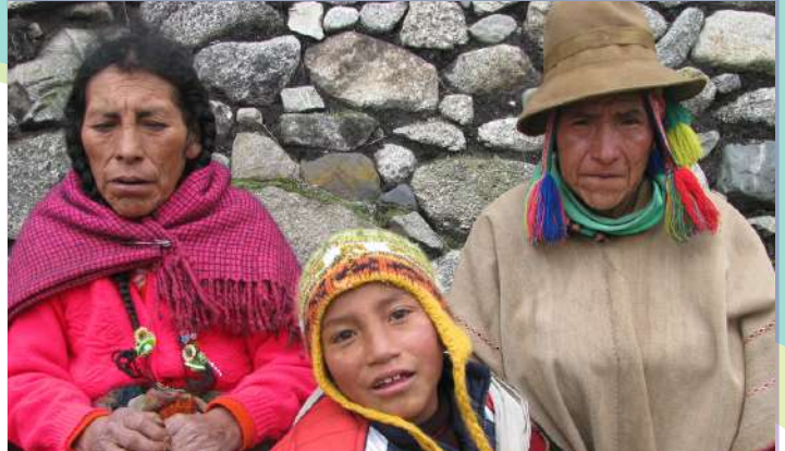
Los abuelos del menor o sus hermanos mayores de edad o sus tíos consanguíneos o sus tutores, pueden declarar en ausencia de los progenitores.

Frente al desconocimiento de quiénes son los padres o porque el menor se encuentra sin cuidados parentales o en riesgo de perderlos, pueden declarar: