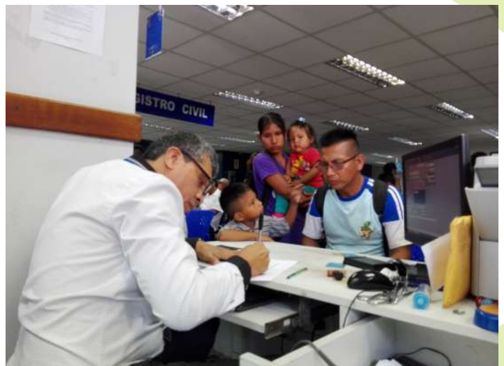
El jefe de la oficina registral es quien emitirá la resolución que aprueba o deniega la inscripción de nacimiento extemporáneo.

El nombre del titular del acta de nacimiento deberá estar integrado por el o los prenombrados y los apellidos: primer apellido del padre y primer apellido de la madre.