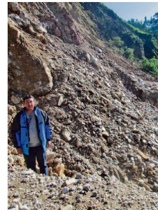
Deslizamientos en carretera.

Rodríguez solicitó apoyo al Gobierno Regional de Cajamarca y al Ministerio de Transportes y Comunicaciones, toda vez que la población se encuentra desabastecida de productos de primera necesidad y combustible, lo que podría agudizarse en los próximos días.