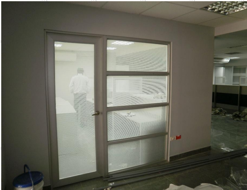
Imagen 06. Vista referencial tabiquería de aluminio y vidrio.

Antes de la fabricación de la tabiquería, el contratista se reunirá con la USGCP.