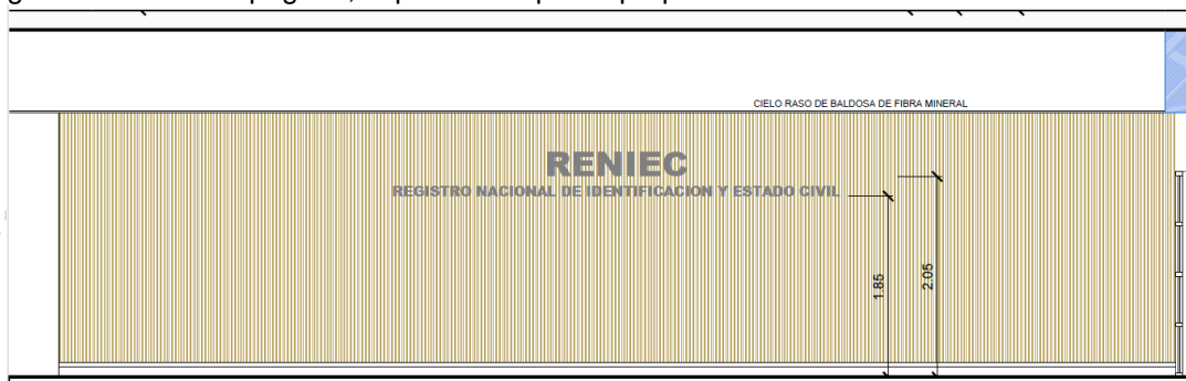
Imagen 04,05. Vista referencial instalación letras. Wall Panel

Las letras pequeñas, con el texto REGISTRO NACIONAL DE IDENTIFICACION Y ESTADO CIVIL tendrán 8cm o 10cm de alto de 25mm de espesor, según espacio disponible, para su instalación la separación entre letras será de 1,5cm aprox., la separación entre palabras será de 8cm aprox., y serán adosadas al Wall panel con pegamento extrafuerte o similar que garantice su buen pegado, el proveedor podrá proponer otra solución de ser el caso.