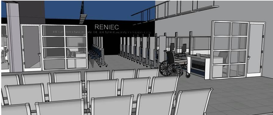
Imagen 07. Vista referencial tabiquería de aluminio y vidrio La unidad de medición será el metro lineal (m)

"Decenio de la Igualdad de Oportunidades para Mujeres y Hombres" "Año de la Esperanza y el Fortalecimiento de la Democracia "